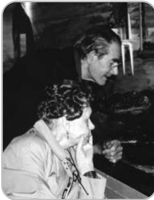
... in Sealife...

Vrijwilligers van Stichting Springlevend zijn actief betrokken bij het verzorgen van middaguitjes. Daarnaast bieden zij ook aan om ouderen te begeleiden naar een winkelcentrum, op een wandeling door een park, bij het bezoeken van de kerstmarkt of een museum... Verder kunnen in overleg bepaalde individuele wensen van ouderen worden ingewilligd.