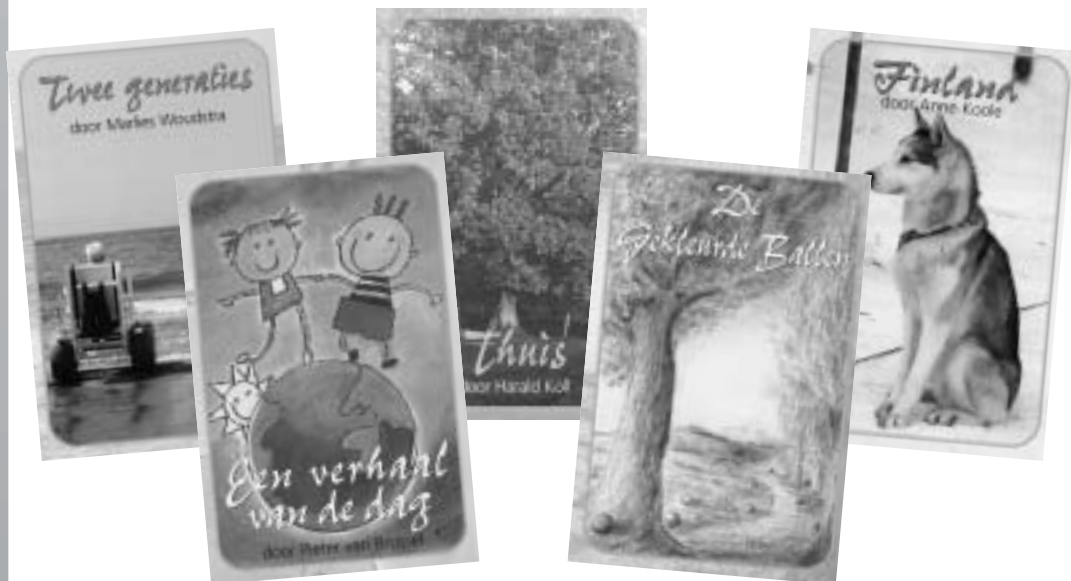
Een aantal tapes uit de tape-bibliotheek,

O.J. Bignell, Voorzitter Stichting Springlevend ♦